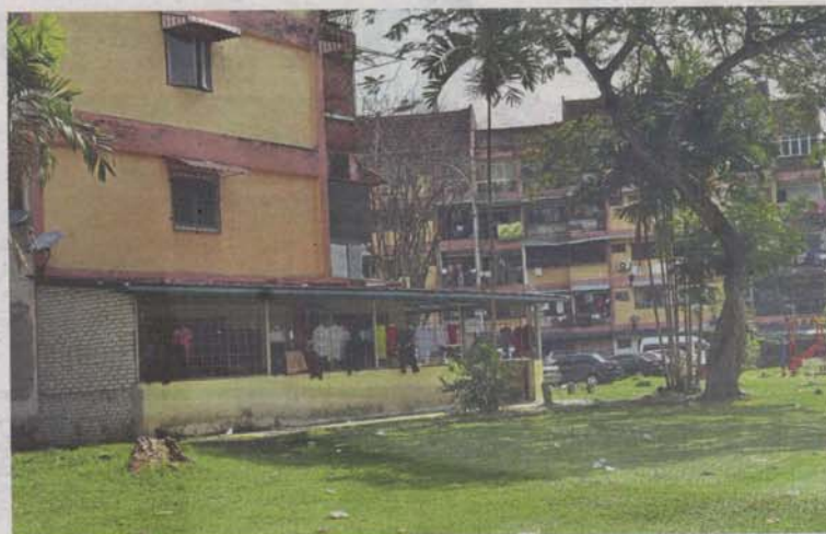
One of the ground floor units that has been extended onto the playground.