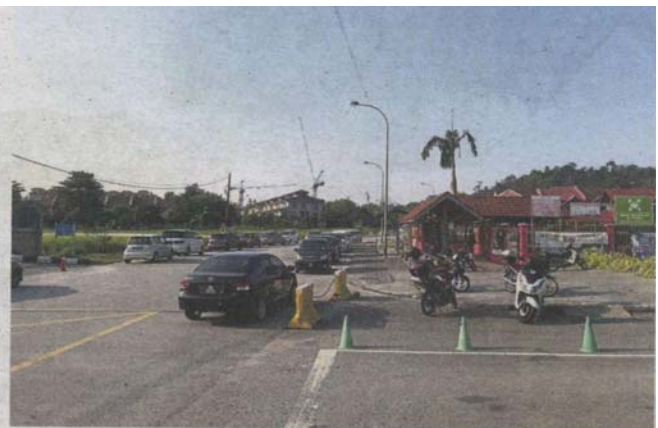
The project site and the school share a two-lane road that is often congested.

project's feasibility, especially since it involved the safety of the children.