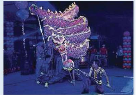
巴生中华独立中学的舞龙队，为现场民众带来了一场精彩绝伦的表演。

(巴生31日讯) 配合地球日一小时 (Earth Hour) 世界熄灯日活动，巴生市议会于周六晚上8时30分，在班达马兰综合体育馆熄灯一小时，以行动应对全球变暖，并且鼓励民众响应低碳生活模式，唤醒他们对保护环境意识。