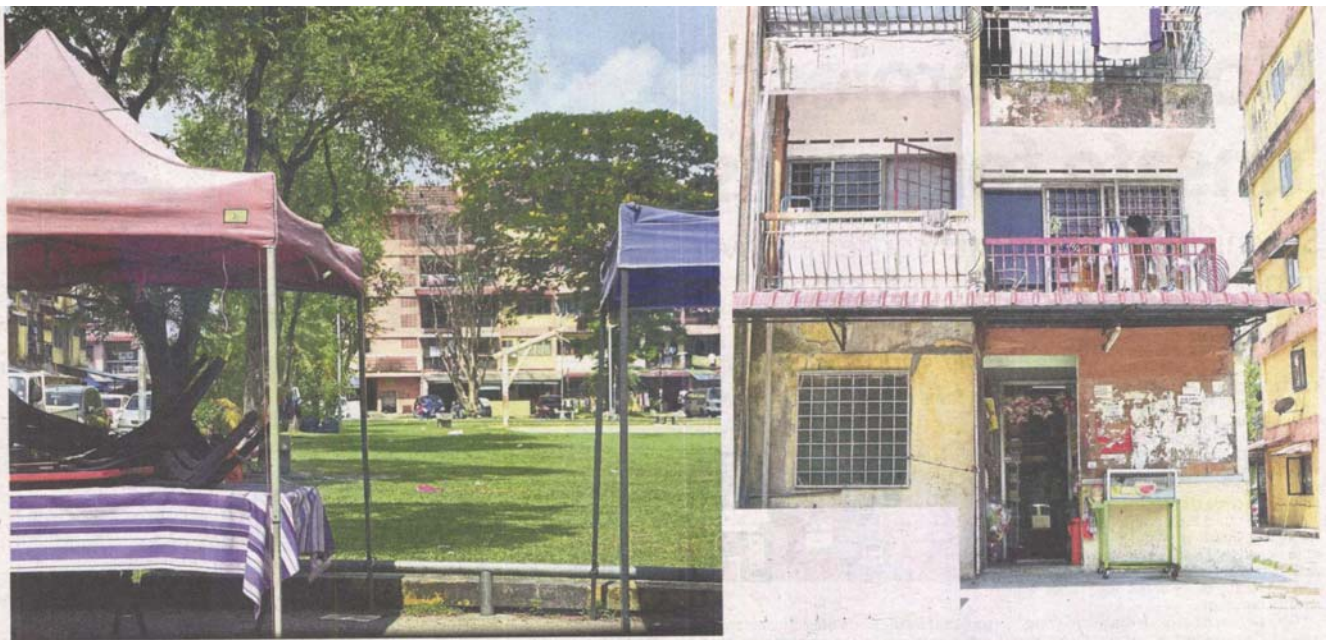
Some petty traders have set up their temporary stalls and taken up the apartments' parking lots. (Right) A ground floor unit at Valencia Apartments that was converted into a shop.

place, but the problems never cease," he added.