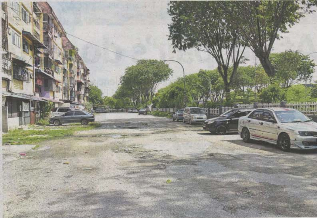
The roads in Valencia Apartments have not been resurfaced in years and the drains are clogged, causing flash floods during the rainy season.

Valencia Apartments management committee is seeking financial help from Selangor government to spruce up place