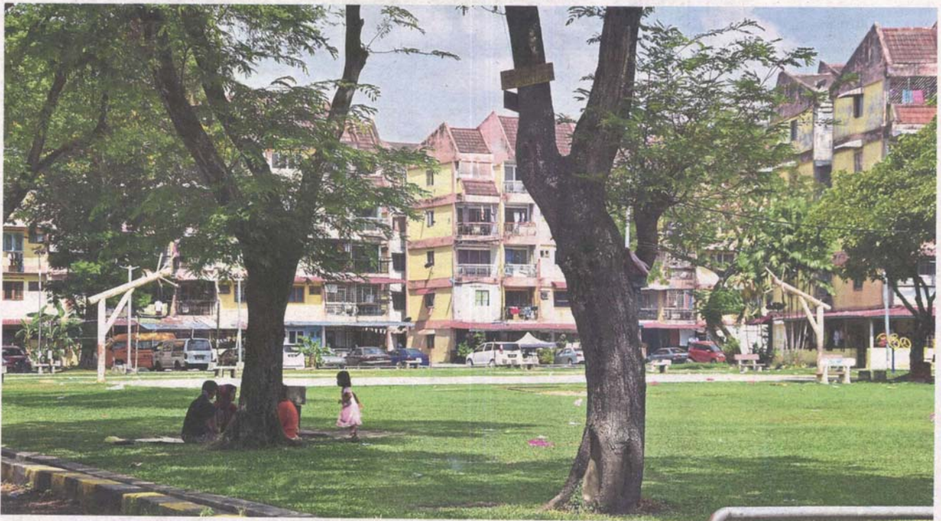
Calm facade: In the daytime, the park at Valencia Apartments seems like a tranquil place but come sundown, drug addicts and unsavoury characters roam the area, forcing residents to stay indoors. — HANIS ABDULLAH/The Star

Despite raids by authorities, residents of Valencia Apartments, Shah Alam, are living in fear and squalor as drug addicts and illegal businesses flourish in their midst. >2&3