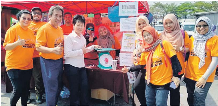
Kaunter kitar semula yang menawarkan hadiah kepada pengunjung sempena Hari Tanpa Kenderaan.

BUKIT SENTOSA - Kaunter Jumpa Sampah Jumpa Hadiah sempena Hari Tanpa Kenderaan mendapat perhatian pengunjung apabila 45 kilogram sampah kitar semula berjaya dikumpulkan pihak penganjur.