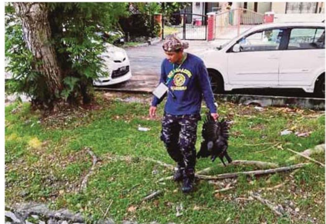
OPERASI menembak gagak yang dijalankan di kawasan MPSJ, semalam.

FAKTA Sasar 1,000 tetapi hanya tembak 673 gagak