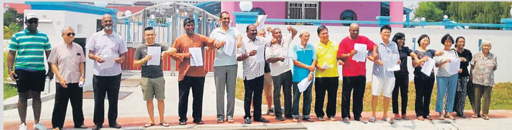
Penduduk berhimpun di hadapan tokong yang didakwa dibina tanpa kebenaran dan mengakibatkan kesesakan lalu lintas.

Menurutnya, pembinaan tokong tersebut dianggap tidak sesuai kerana boleh menyebabkan kesesakan lalu lintas di kawasan perumahan tersebut.