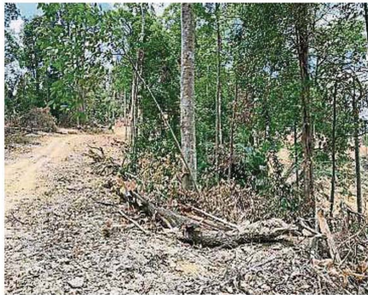
武吉澤拉克森林保留地遭破壞，不少大樹已被砍伐。

（八打灵再也31日讯）雪州政府日前发出停工令，阻止发展商继续入侵武吉泽拉克（Bukit Cerakah）森林保留地！