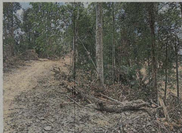
■雪州政府已向发展商发出停工令,避免武吉泽拉克森林保留地遭进一步破坏。

在这之前,掌管雪兰莪州环境、绿色工艺、消费人、科学、工艺及革新事务的行政议员许来贤曾于3月26日前往现场勘查,他当时表示尽快与相关单位,即雪兰莪州土地与矿物局、雪兰莪州森林局及沙亚南市政厅开会,一起商讨该如何针对发展商的行